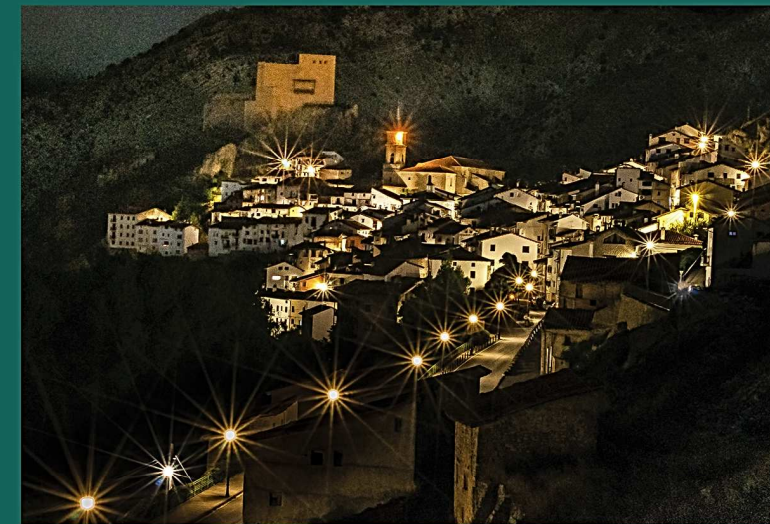
FOTOGRAFÍA: La noche en Alcalá. Luis Aparisi Querada. Ganadora del Concurso de Fotografía 2014

Tema: "Redescubriendo Gúdar – Javalambre"