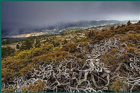
FOTOGRAFÍA: Sabinas rastreras de Javalambre. Luis Antonio Gil Pellín. 2º premio Concurso de Fotografía 2014