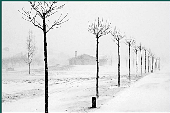
FOTOGRAFÍA: La ventisca. Manuel Jimenez Martínez. Ganadora del Concurso de Fotografía 2013